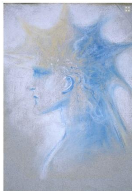
En Sidhe-kriger malet af den irske teosof Georg William Russel, som også var clairvoyant (1867-1935).

Irsk historiefortælling er en blanding af konkret historie og