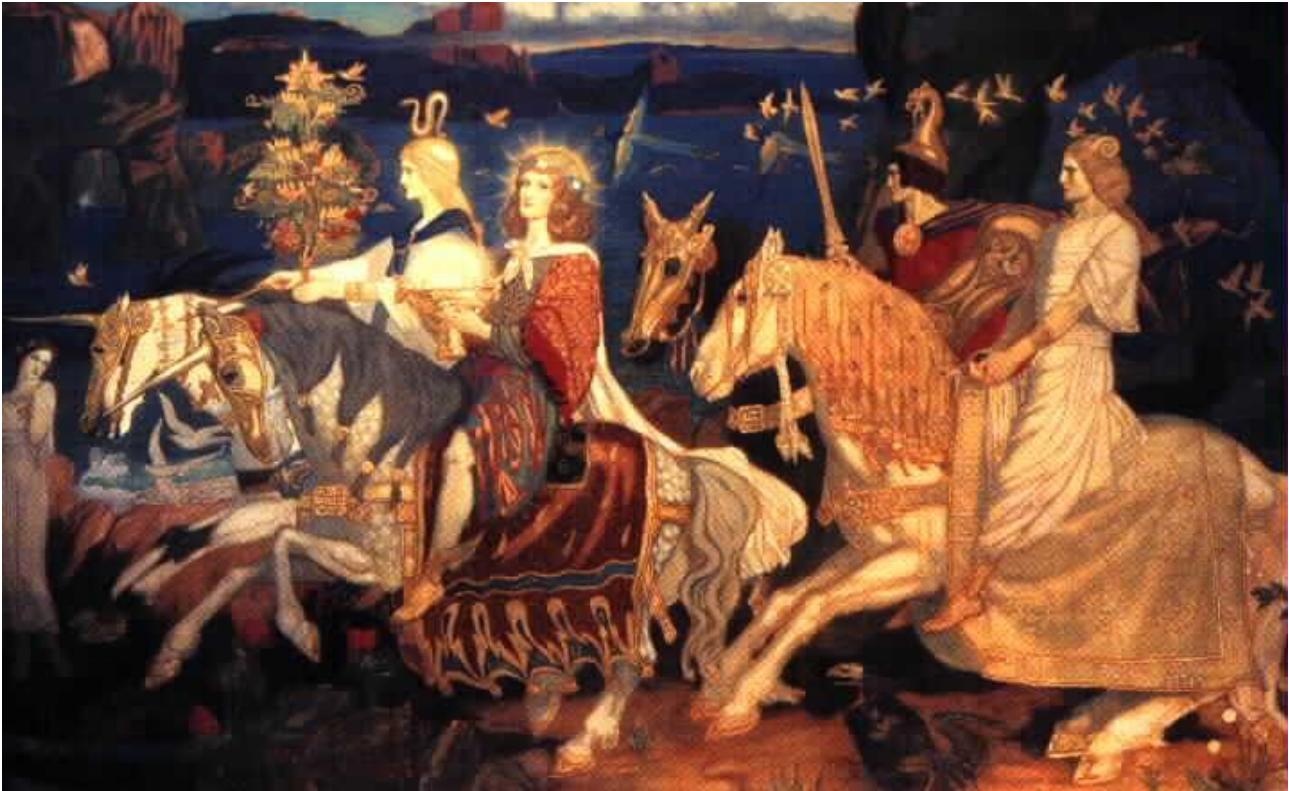
Eksistensen af elverfolk er beskrevet i forskellige kulturer; den keltiske tradition spiller dog en central rolle. Her maleriet The Riders of The Sidhe fra 1911, malet af John Duncan, Skotland (1866-1945)

deres bekymring for, at vi risikerer at fastholde dem i fortidens tankeformer som eksotiske elvervæsener med spidse ører og magiske kræfter. Hvis vi fokuserer på dem som et romantisk elverfolk, eller som halvguder, så vil samarbejdet ikke lykkes. De er i udvikling ligesom vi, og vi behøver samarbejde. De har deres primære fokus i de mentale og astrale regioner, og med forbindelser ned til den æteriske del af det fysiske plan, især gennem fokuspunkter i naturen og ved særlige helligsteder. Men de mærker virkningerne af vores kriser, og de har selv brug for at komme ud af deres mere eller mindre tilbagetrukne liv.